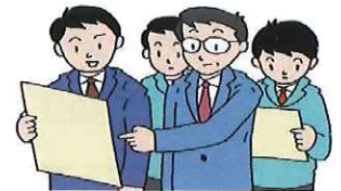
無理ないビジネスプランをつくらう

国の中小企業向け補助金の平成29年度補正予算が平成30年1月に成立見込みです。以降に補助金公募申請が始まります。小規模事業者等の皆さんの経営課題である販路開拓、新商品開発、設備投資などの課題解決や皆さんのビジネスプランの後押しをする国などの補助金制度の説明会を次により開催しますので、ご参加ください。なお、公募前の現時点で把握する補助制度の説明ですので、公募時期、補助要件、採択内容については、お問い合わせ頂くなどご留意をお願いします。